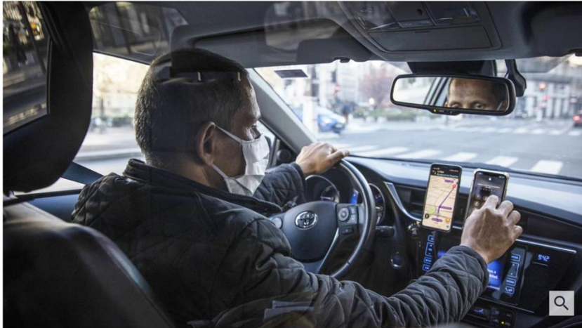
Prekär beschäftigt: ein Uber-Fahrer in Paris.

9. Dezember 2021, 12:54 Uhr | Lesezeit: 2 min