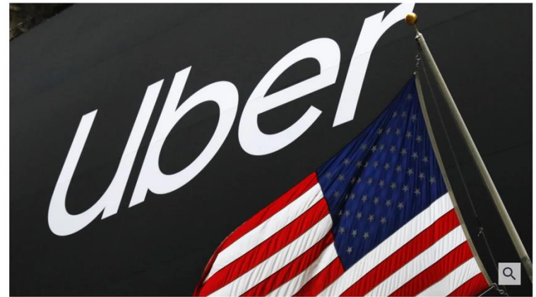
Allein in den Jahren 2019 und 2020 gab es in den USA Uber zufolge Berichte über 3824 sexuelle Übergriffe von Fahrern.

14. Juli 2022, 1:43 Uhr | Lesezeit: 2 min