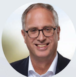
Tobias Koch MdL